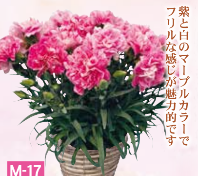
M-17 カーネーション ファンシーバイオレット 税抜3,480円 (税込3,828円)