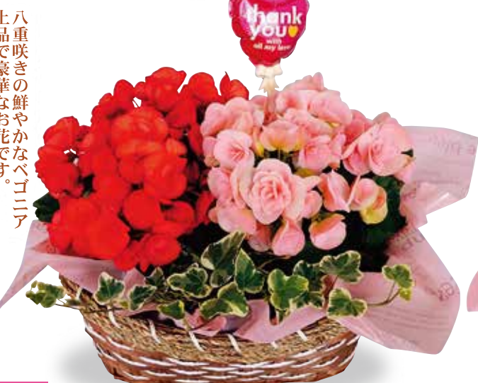
M-10 ベゴニア 寄せカゴ 税抜4,000円 (税込4,400円)