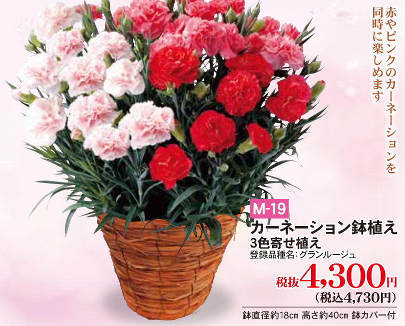
M-19 カーネーション鉢植え 3色寄せ植え 登録品種名: グランルージュ 税抜4,300円 (税込4,730円)