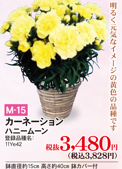
M-15 カーネーション ハニームーン 登録品種名: 11Ye42 税抜3,480円 (税込3,828円)