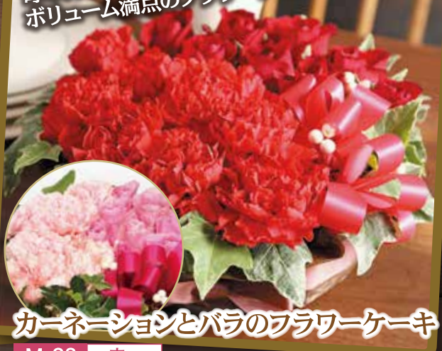
カーネーションとバラのフラワーケーキ