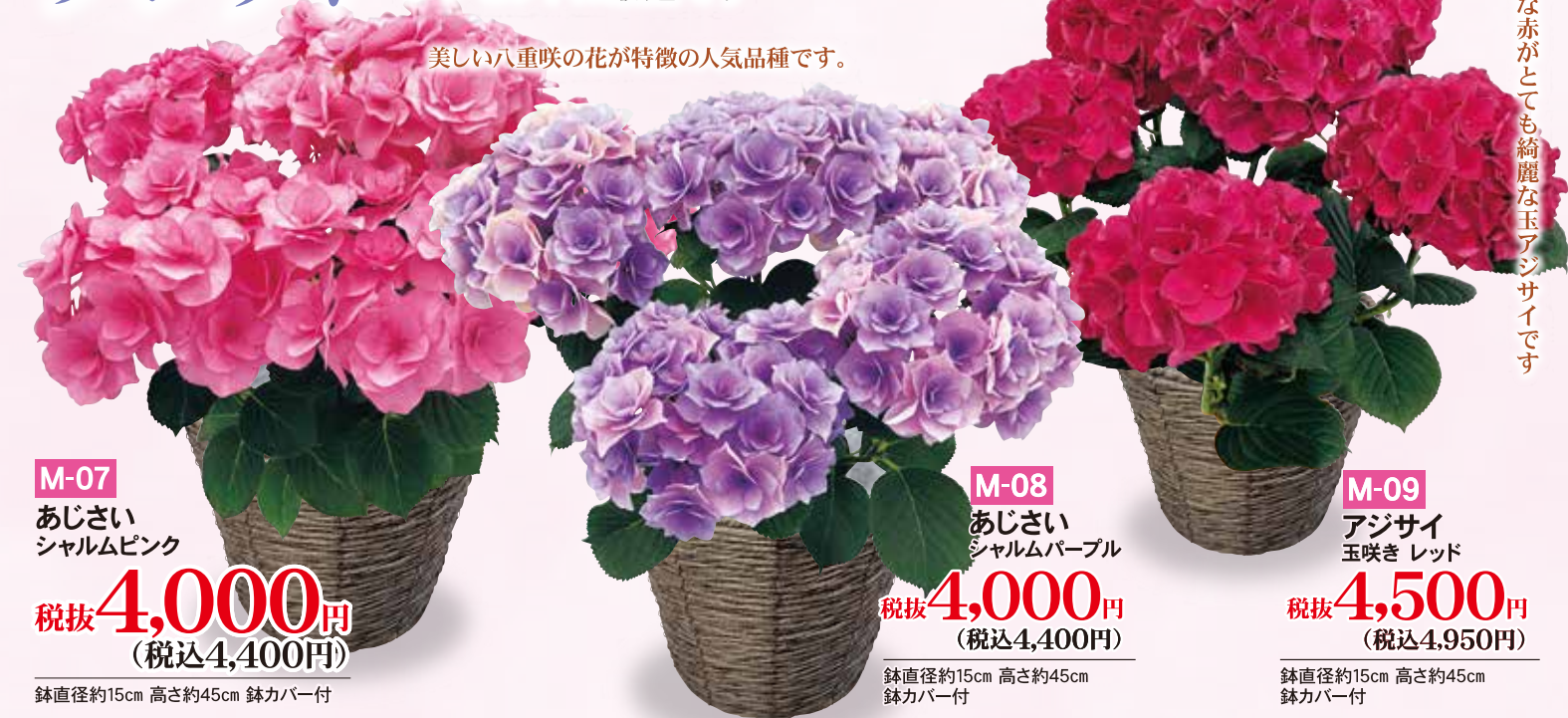
M-07 あじさい シャルムピンク 税抜4,000円 (税込4,400円)