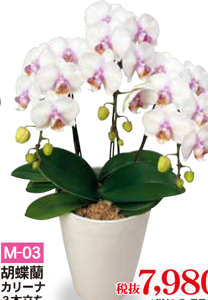
M-03 胡蝶蘭 カリーナ 3本立ち 税抜7,980円 (税込8,778円)