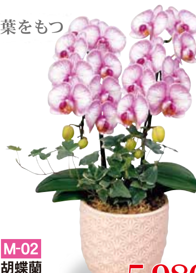
M-02 胡蝶蘭 ラプリーエフェクト 2本立ちアレンジ 税抜5,980円 (税込6,578円)

鉢直径約16cm 高さ約50cm 専用信楽焼き鉢 ※花色はイメージです。多少色味が変わることがございます。