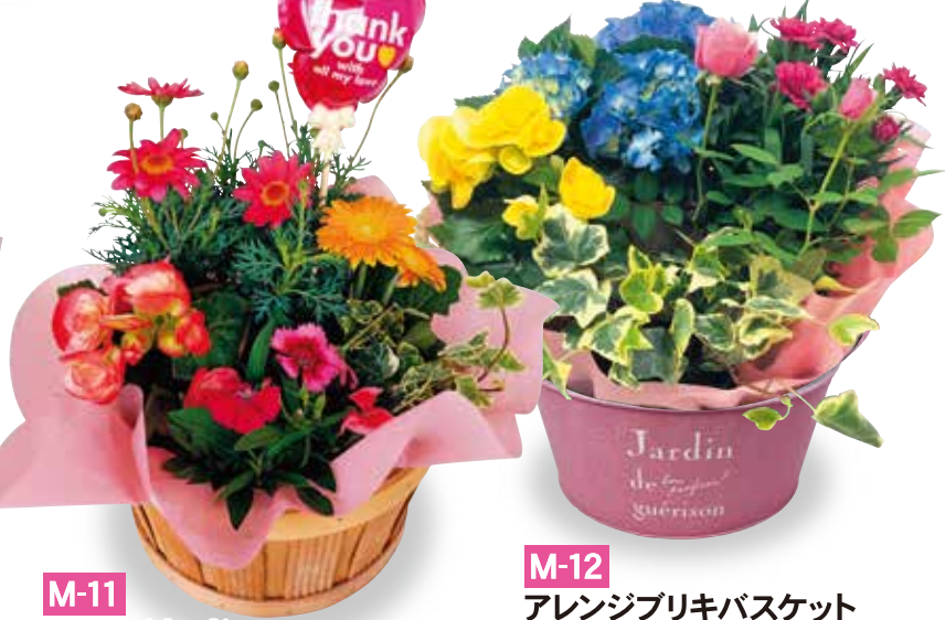
M-11 アレンジウッド バスケット 寄せカゴ 税抜3,000円 (税込3,300円)