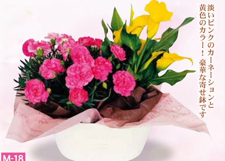
M-18 カーネーション&カラー 寄せカゴ 税抜4,000円 (税込4,400円)