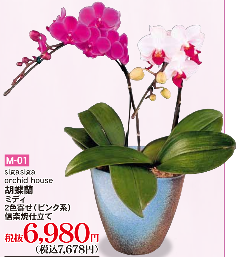
M-01 sigasiga orchid house 胡蝶蘭 ミディ 2色寄せ(ピンク系) 信楽焼仕立て 税抜6,980円 (税込7,678円)

sigasiga orchid houseはアヤハが運営する胡蝶蘭ブランドです。手間をかけて丁寧に育てた「最上級」の胡蝶蘭をお届けいたします。