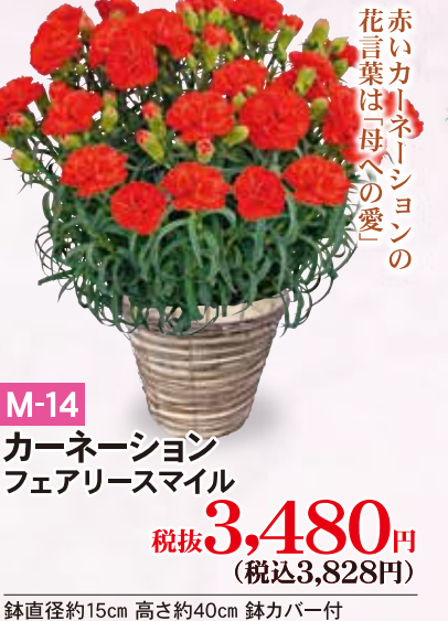
M-14 カーネーション フェアリースマイル 税抜3,480円 (税込3,828円)