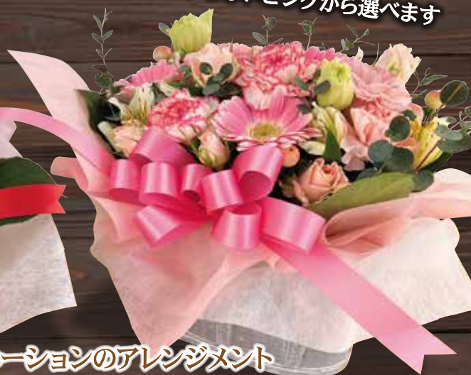
ガーベラとカーネーションのアレンジメント

M-20 赤系 税抜 各 5,000円 (税込各5,500円) M-21 ピンク系