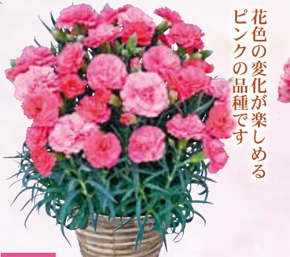
M-16 カーネーション さくらもなか 登録品種名: さくらもなか 税抜3,480円 (税込3,828円)