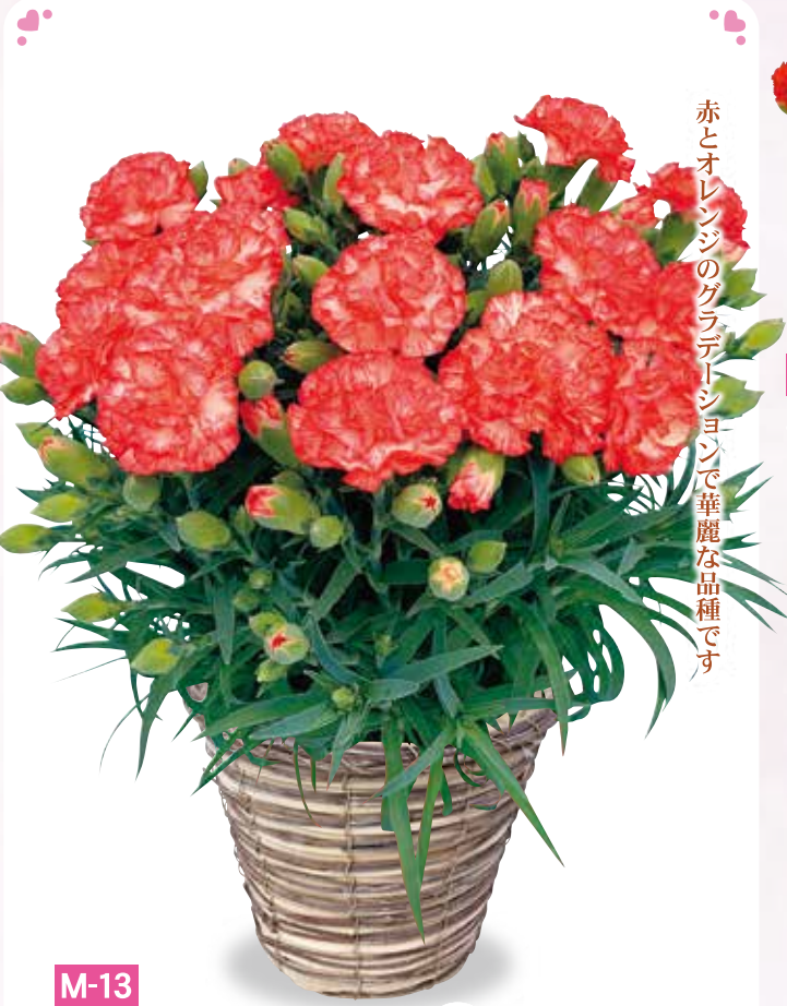
M-13 カーネーション テキーラ 税抜3,480円 (税込3,828円)